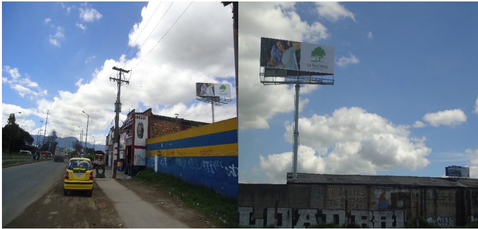
VALLA INSTALADA EN EL PREDIO AC 13 No 72-35